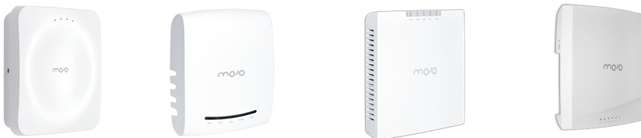
左から Mojo C-130*、Mojo C-75、Mojo C-100、Mojo C-110* 製品本体イメージ *はトライラジオ(第3の無線)搭載モデル

販売製品は、『Mojo C-130』*、『Mojo C-75』*の2製品で、2017年夏より『Mojo C-100』、『Mojo C-110』の取扱いも拡充することで、ユーザーの設置環境やニーズに合った製品のご提案をおこないます。